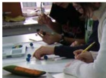
Figura 3. El proceso de construcción de una molécula.

La sensación de que el problema al que se enfrentan supera sus capacidades planea sobre la clase, pero rápidamente se recupera el ánimo cuando alguno de los equipos (por razona-