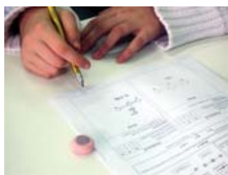
Figura 4. Rellenando la ficha.